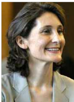
Amélie Oudéa-Castéra Ministre des Sports et des Jeux Olympiques et Paralympiques